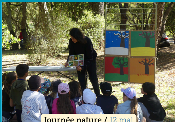
Journée nature / 12 mai