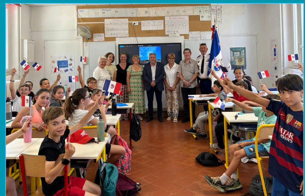
Les "Chemins de la mémoire" / 26 mai