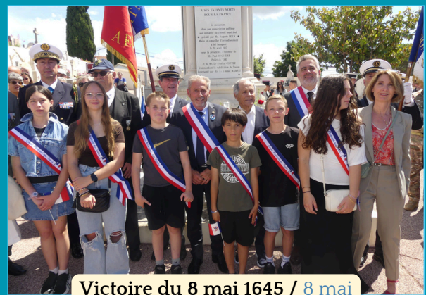
Victoire du 8 mai 1645 / 8 mai