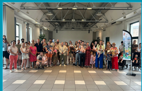
Remise des livres de naissance / 29 mai