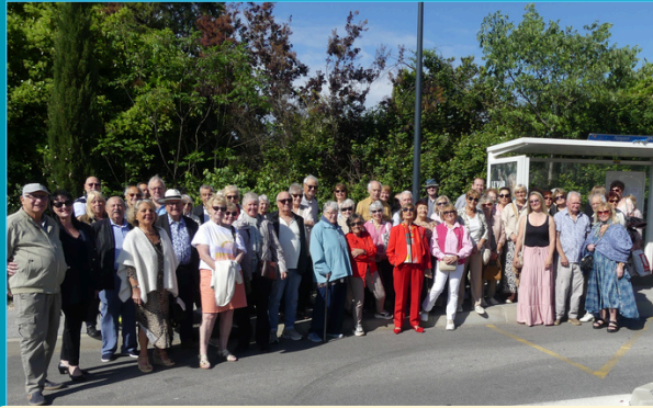
Fête du Printemps au Domaine "Le Billardier" 23 avril