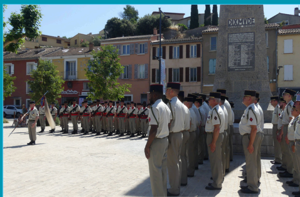
Prise de commandement - 54e RA / 27 mai