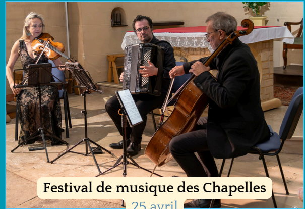
Festival de musique des Chapelles 25 avril