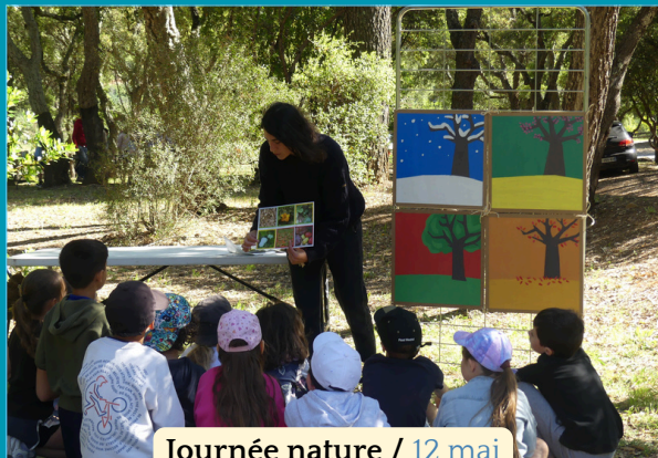
Journée nature / 12 mai