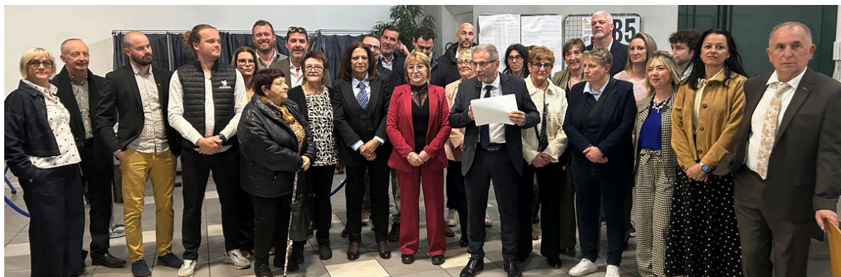
Annonce des résultats des élections municipales - 16 mars 2026