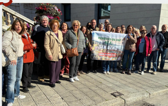
Sortie à San remo 28 mars