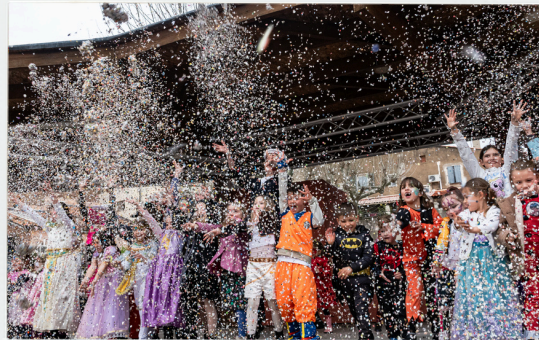
Carnaval 8 mars