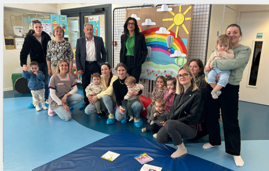
Semaine Nationale de la Petite Enfance du 16 au 20 mars