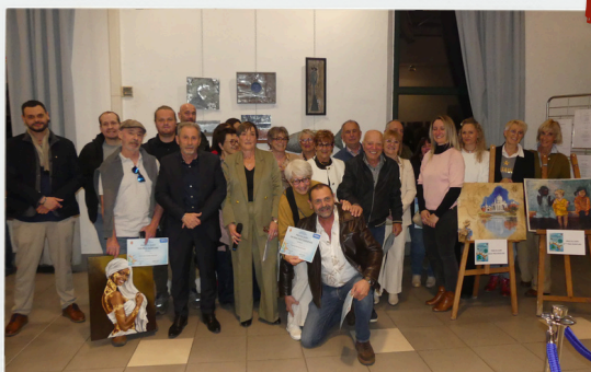
Rencontres Artistiques 27 mars