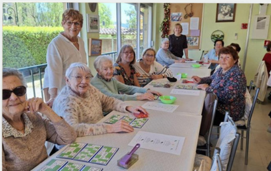
Loto au Club Henri Paguet 3 avril