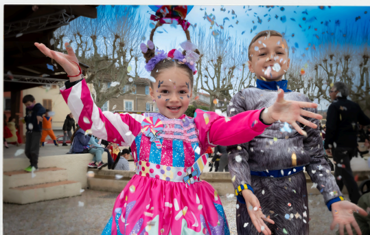
Carnaval 8 mars