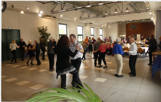
Thé dansant 5 mars