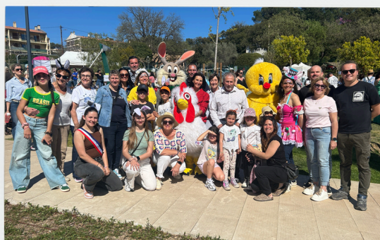
Pâques 4 avril