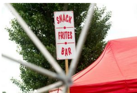
Activité de restauration ambulante