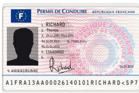
Permis de conduire