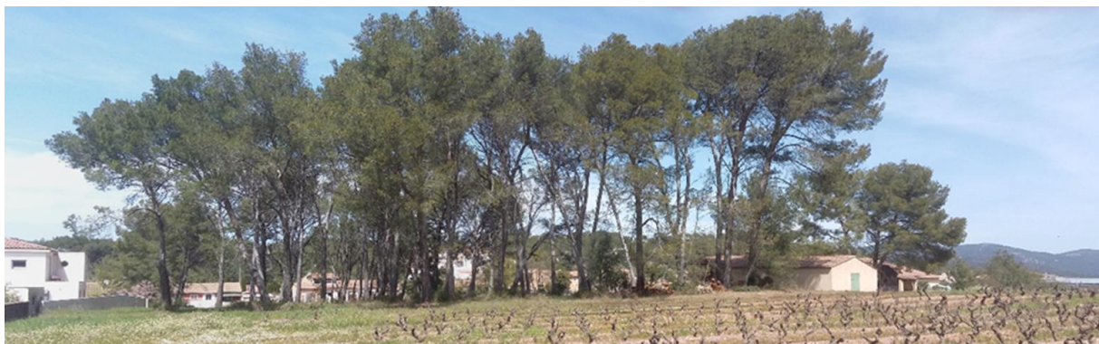
EBC à supprimer au Pas de la Garenne

La surface d'EBC à supprimer sur le secteur du Pas de la Garenne avoisinant 2500 m 2 , cette superficie pourra être prise en compte dans les surfaces d'Espaces Naturels, Agricoles et Forestiers (ENAF) consommées, en l'application de la loi Climat et de son objectif de Zéro Artificialisation Nette (ZAN). A titre indicatif, il informe que la DDTM a transmis (début 08/23) un document cadre faisant office de doctrine concernant la méthodologie à utiliser pour calculer ces ENAF consommés.