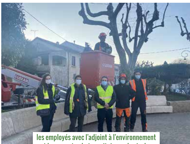
les employés avec l'adjoint à l'environnement et les experts phytosanitaires arboricoles