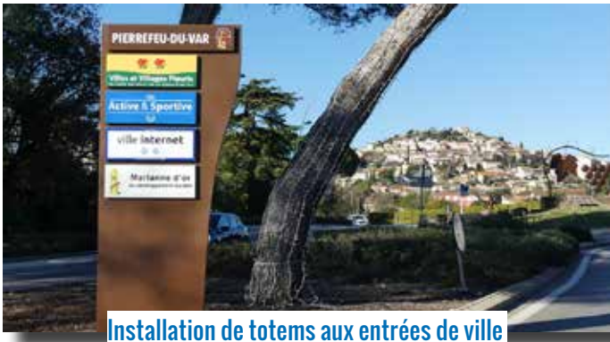
Installation de totems aux entrées de ville