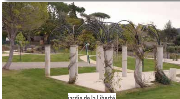
jardin de la Liberté