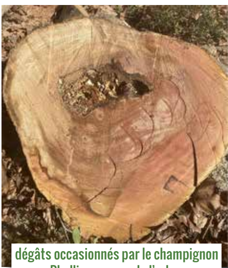
dégâts occasionnés par le champignon Phellin au cœur de l'arbre

Cette année, suite à l'expertise de notre parc arboré, trois platanes ont dû être abattus place Gambetta. La Commune s'engage bien entendu à replanter ces trois platanes à l'automne prochain.