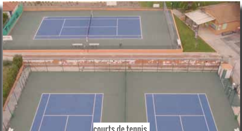
courts de tennis