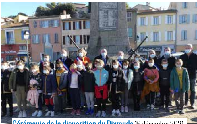
Cérémonie de la disparition du Dixmude 16 décembre 2021