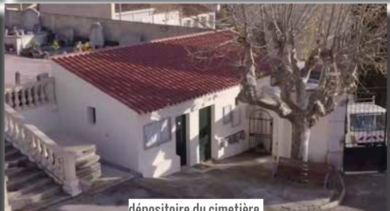
dépositaire du cimetière

M ais d'ores et déjà, 2022 s'annonce également comme une année où de belles réalisations au bénéfice des Pierrefeucaïns, devraient voir le jour. Parmi ces projets, citons :