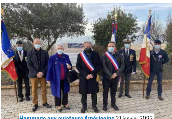
Hommage aux aviateurs Américains 27 janvier 2022