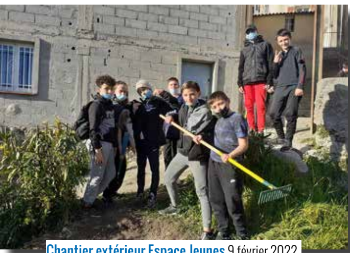
Chantier extérieur Espace Jeunes 9 février 2022

Retrouvez les photos sur www.pierrefeu-du-var.fr (rubrique "En images")