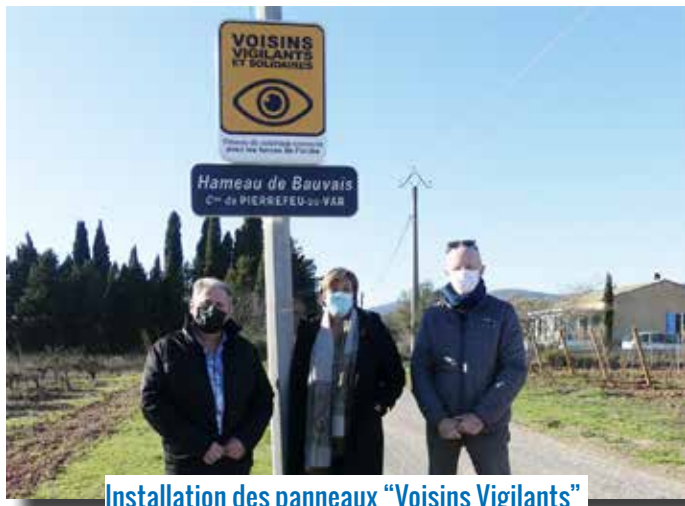
Installation des panneaux "Voisins Vigilants"