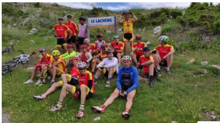
sorties club 2021