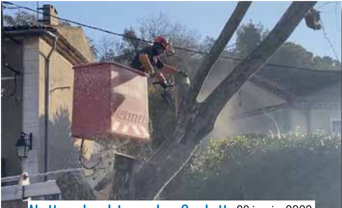
Abattage des platanes place Gambetta 26 janvier 2022