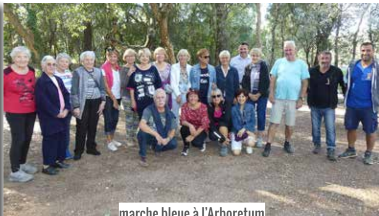
marche bleue à l'Arboretum