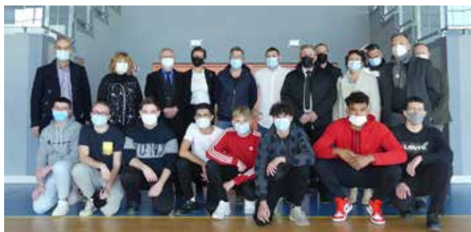
Extension vidéoprotection avec les élèves du lycée Cisson